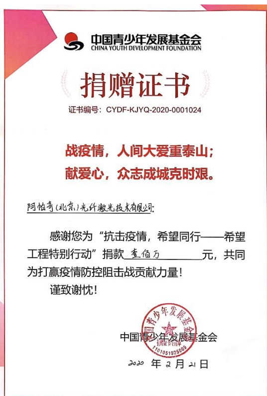
“中国青少年发展基金会”捐赠证书

第二：向中华思源工程扶贫基金会的“思源赈灾”项目捐款人民币38万元（约合美元5.7万）。该款项将用于为湖北的医院采购呼吸机、医疗器械、医药用品等。